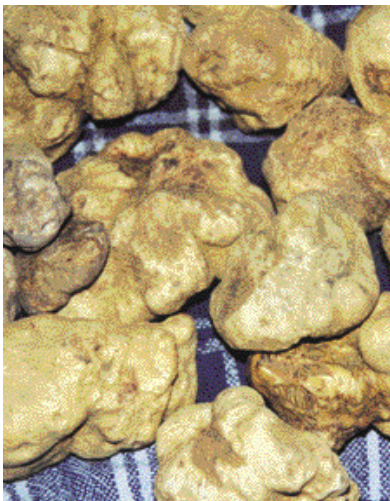
Joli lot de truffes blanches d'Italie récoltées en peupleraie.

l'importance des facteurs écologiques ? Or, seules les éclaircies peuvent garantir un écosystème truffier vigoureux et conquérant, apte à limiter les risques d'autres contaminations fongiques.