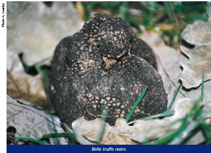
Belle truffe noire.