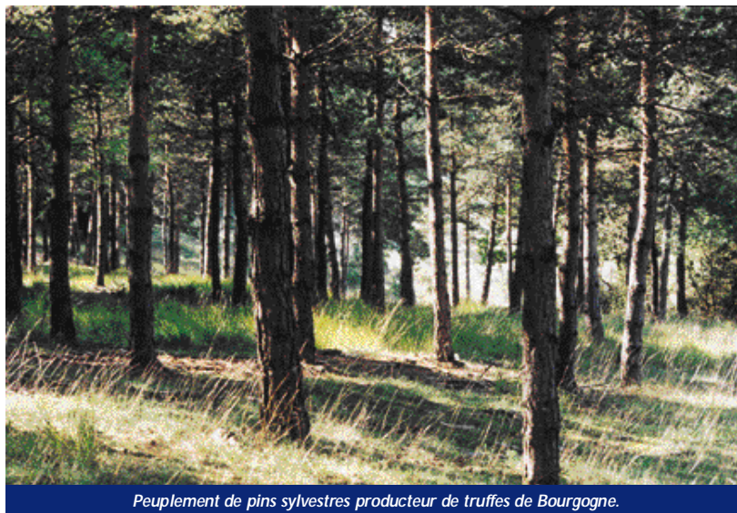
Peuplement de pins sylvestres producteur de truffes de Bourgogne.

Assez curieusement, cette pratique a été abandonnée en trufficulture moderne... Est-ce la trop grande confiance en des plants bien mycorhizés et donc réputés infaillibles ? Ou encore, une sous-évaluation de