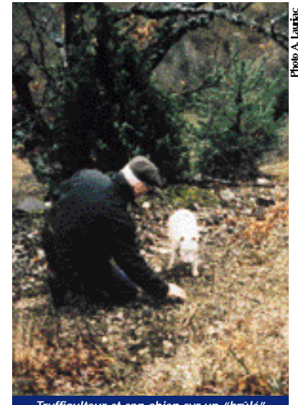
Trufficulteur et son chien sur un "brûlé" producteur de truffes noires.

Aujourd'hui, l'essentiel de la production provient de boisements créés de mains d'homme, par plantation d'arbres mycorhizés. Les truffières