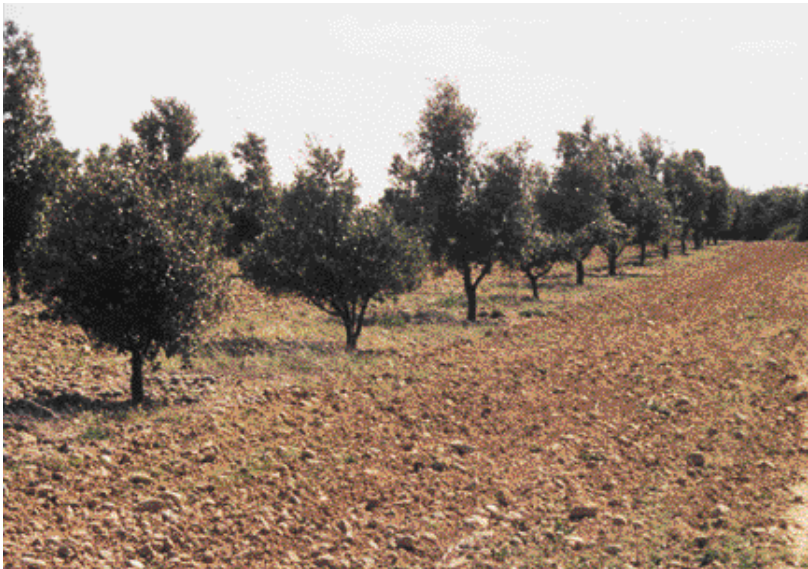
Pare-feu cultivé, dédié aux arbres truffiers, ici chênes verts producteurs de truffes noires.

entrelacée de fines veines blanches. On trouve cette truffe au sud de la Loire essentiellement, en Italie et en Espagne, sous des climats à étés chauds et secs, à une altitude comprise entre 0 et 1 000 m. Elle affecte les milieux arborés.